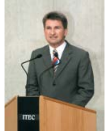
Professor Dr. Andreas Pinkwart