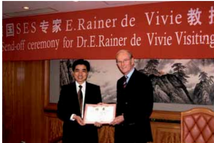
Der Senior Experten Service (SES) besteht bereits seit 25 Jahren und leistet Hilfe zur Selbsthilfe