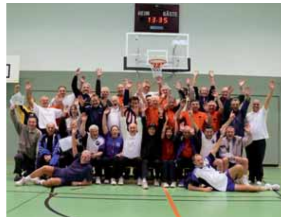
Der Dünnwalder Turnverein hat sich mit seinen Herzgruppen als erster Verein am 31. März 08 mit hervorragendem Ergebnis an der Qualitätssicherung beteiligt.

Nähere Infos über die Qualitätssicherung erhalten Sie unter unserer Vereinsnummer: (0 22 1) 37 64 66 50