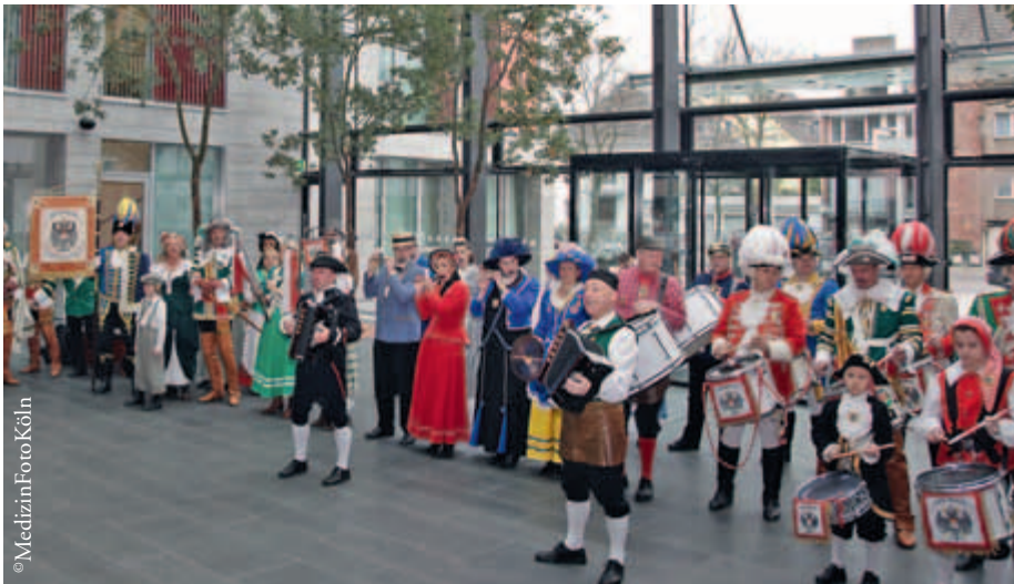
Aufmarsch des „Reiter-Korps Jan von Werth“ in Begleitung der „Fidelen Kölschen“ im Foyer des Herzzentrums.

Kölns „Reiter-Korps Jan von Werth“ e.V. schenkt herzkranken Kinder zu Karneval ein Stück Lebensfreude