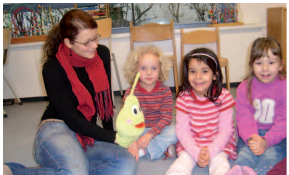
„Ball und Birne“ im Kindergarten: Die Birne steht für gesunde Ernährung, der Ball für Spaß und Bewegung ...